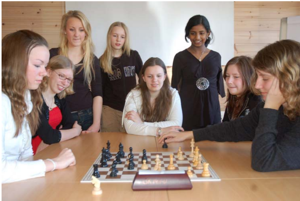
De norske deltakerne under Nordisk mesterskap for jenter i Oslo.